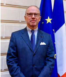
Pascal Mailhos, préfet de la région Auvergne-Rhône-Alpes, préfet du Rhône

Présenté le 3 septembre 2020, le plan de relance se déploie aujourd'hui sur notre territoire, avec de premiers effets concrets. Nous pouvons d'ores et déjà nous féliciter que notre région y figure à sa juste place, tant dans