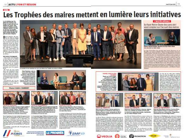
Compte-rendu dans LE PROGRES