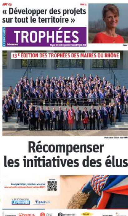
Supplément de l'événement dans LE PROGRES